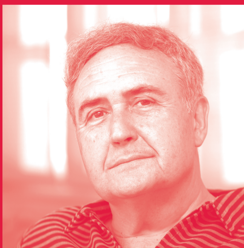
VICENTE MOLINA FOIX